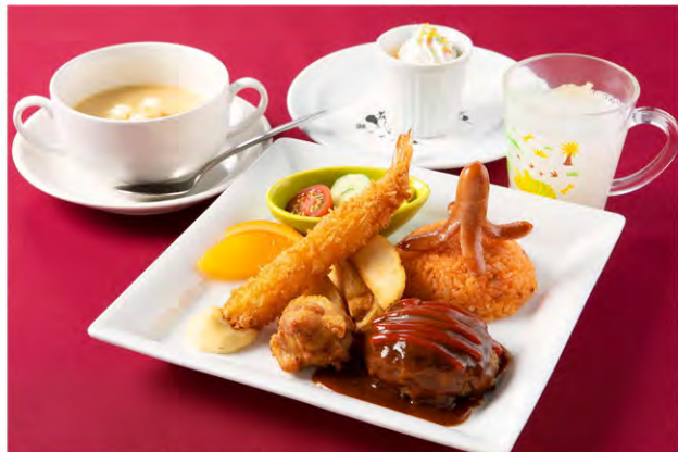
キッズプレート Kid's Plate

スエヒロハンバーグ90g/からあげ/ソーセージ/エビフライ フライドポテト/スエヒロスープ/ジュース/自家製プリン