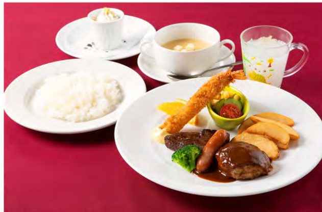
ジュニアセット Junior Set

スエヒロ特選牛ステーキ40g/スエヒロハンバーグ90g/ソーセージ エビフライ/ライス小/スエヒロスープ/ジュース/自家製プリン