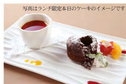
写真はランチ限定本日のケーキのイメージです