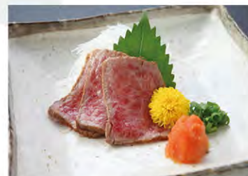
大人気の牛の炙り (写真は1人前です)

※季節によって、団体様向けの別途特別プランをご用意しております。 宴会をお考えの幹事様は、スタッフまでお尋ね下さいませ。