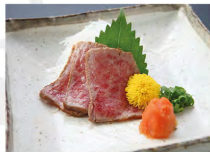
大人気の牛の炙り (写真は1人前です)