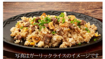
写真はガーリックライスのイメージです

パンの追加 2個 200円 〔税込〕 4個 350円 〔税込〕 6個 500円 〔税込〕 8個 650円 〔税込〕 12個 950円 〔税込〕