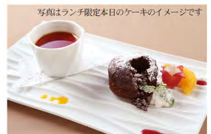
写真はランチ限定本日のケーキのイメージです