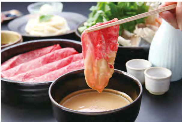
秘伝の胡麻タレは伝統の製法で受け継がれています

近江牛リブローズ、野菜、玉子、三連小鉢・縮めのうどん、ごはん、香の物、デザート <雅> 牛の炙りまたは牛の味噌漬けまたはお魚の刺身、果物