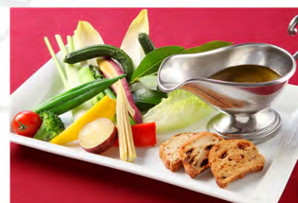
季節野菜のバーニャ・カウダ

野菜は季節によって変わります。旬の食材を自家製のバーニャカウダソースで。パンとの相性も抜群なのでメインディッシュのご注文では是非パンをお選び頂き、ディップして召し上がって下さい。