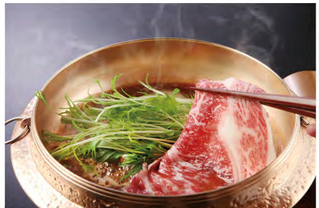
当店のすき焼きはしゃぶしゃぶ風に召し上がって頂きます